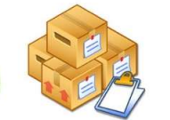
ฝ่ายสินค้าคงคลัง