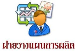
ฝ่ายวางแผนการผลิต