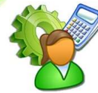
ฝ่ายบัญชีต้นทุน